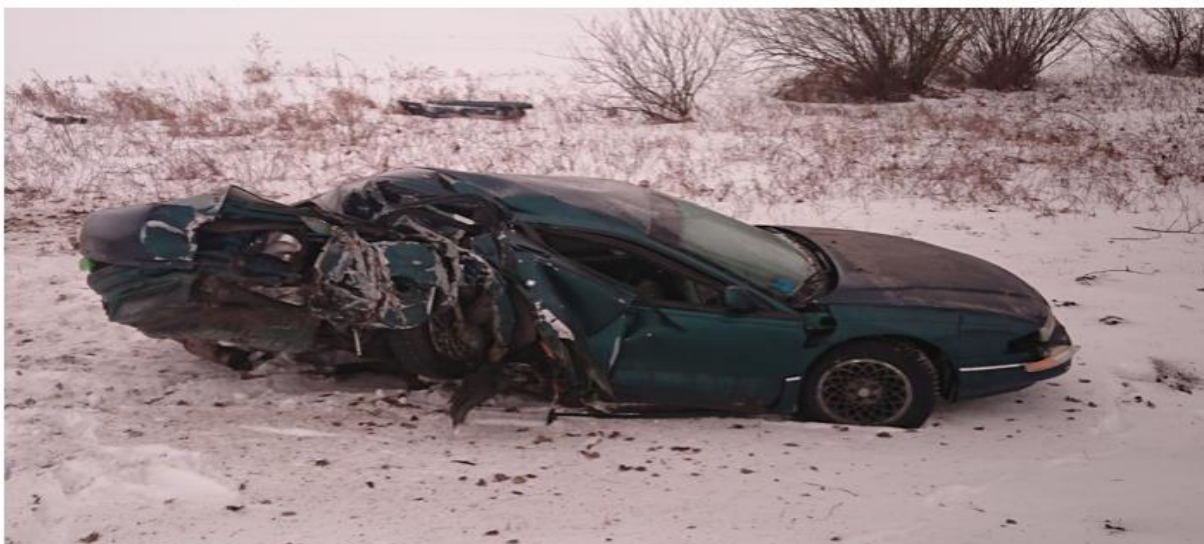
Фото 2-3: Вид транспортного средства после произошедшего дорожно-транспортного происшествия.

Также 12.06.2019 около 15.55 часов жительница г. Слуцка, управляя автомобилем «Рено Сандеро», перевозя в салоне автомобиля без удерживающих устройств двух несовершеннолетних и двух малолетних детей, двигаясь по второстепенной автодороге «Погост-Слуцк», проигнорировала требования дорожного знака 2.5 «Движение без остановки запрещено», выехала на проезжую часть главной автодороги «Бобруйск-Глуск-Любань, где допустила столкновение с автомобилем «МАЗ 650118».