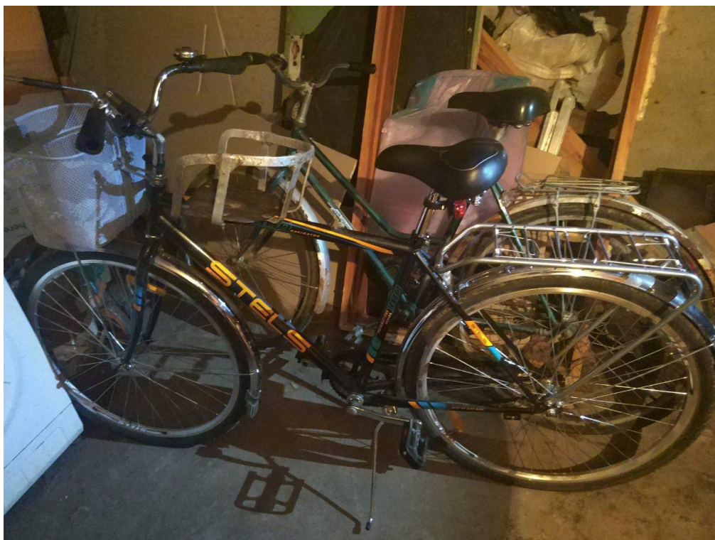
Фото 1: Вид велосипеда, на котором осуществлялась перевозка детей.

В первом полугодии 2019 года имели место еще два факта аналогичных происшествий, которые произошли на территории Клецкого и Солигорского районов, в результате которых малолетним причинены телесные повреждения различной степени тяжести.